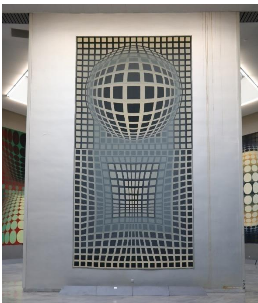
Figure 2 VP SURKE, vue générale