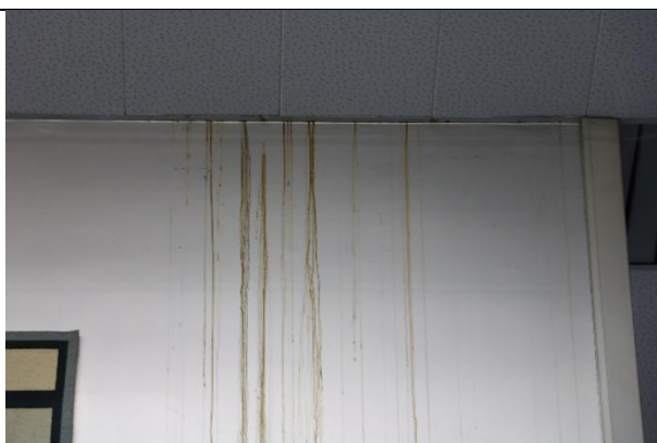
Figure 4 VP SURKE, détail fond, dégât des eaux, en haut à droite