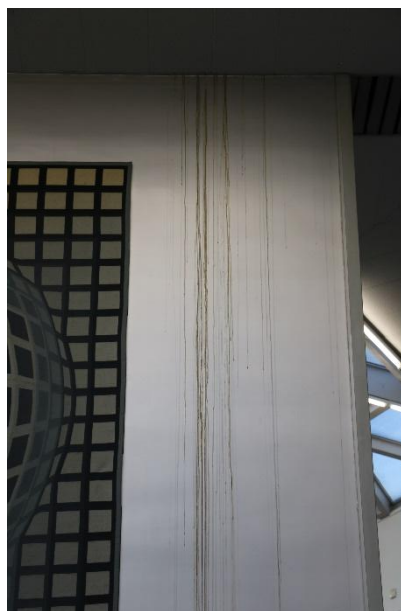
Figure 3 VP SURKE, détail fond, dégât des eaux