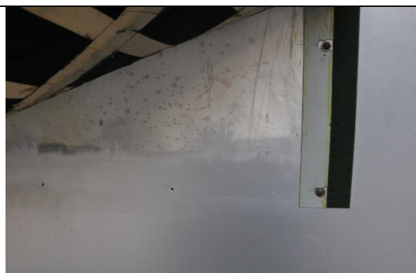
Figure 7 VP SURKE, détail de l'accrochage de la tapisserie