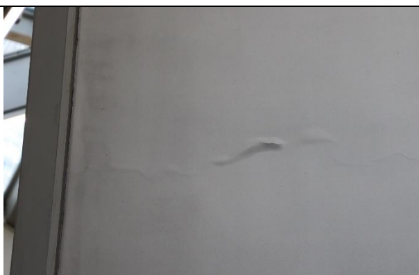
Figure 6 VP SURKE, détail fond, soulèvement de la peinture, en haut à gauche